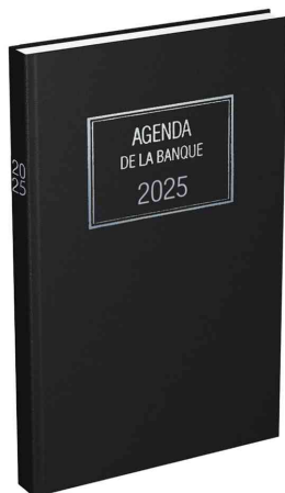
Agenda journalier Banquier Large - 1 volume