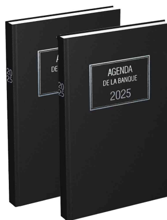
Agenda journalier Banquier Large - 2 volumes