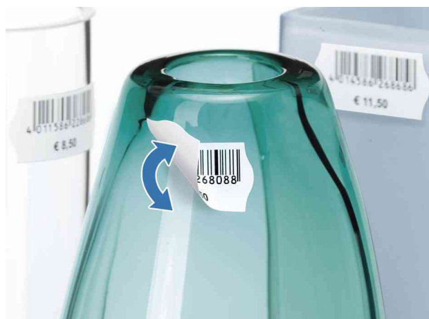
Preis-Etiketten SPECIAL, Anwendung