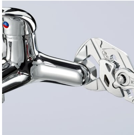
Para trabajar en superficies tratadas sin dañarlas