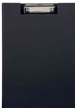
Porte-bloc à pince MAULbalance, noir