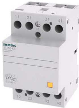
INSTA-Schütz mit 4 Öffnern Kontakt für AC 230V, 400V 40A Ansteuerung AC/DC 24V