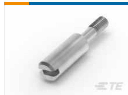
TE Teilnr.:T0931003003-000 CODING-PIN-M3