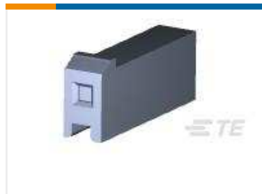
TE Teilnr.:640250-1 01P SL156 HSG W/LCK RAMP NATL