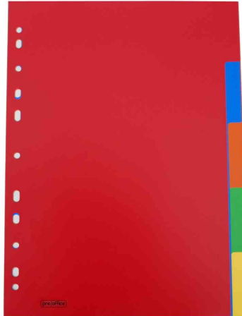
Kunststoff-Register, DIN A4, 5-teilig