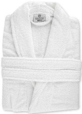
Bademantel mit Schalkragen