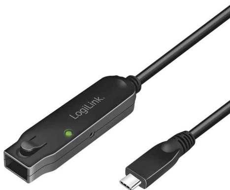
USB 3.2 Gen2 Aktives Verlängerungskabel, USB-C