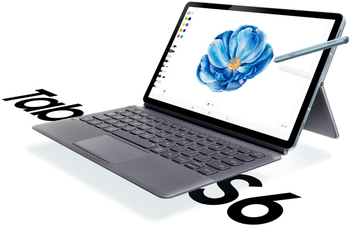
Image simulated. Keyboard sold separately.