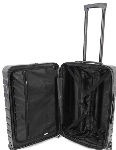
Trolley de voyage, ouvert