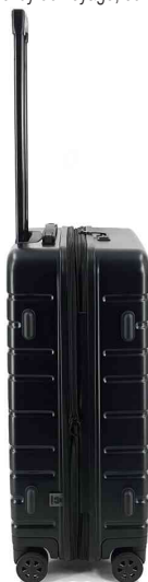
Trolley de voyage, vue latérale