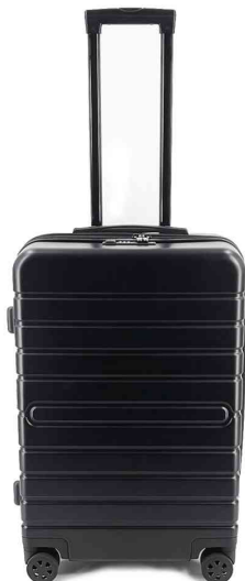
Trolley de voyage