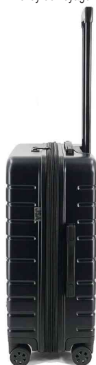
Trolley de voyage, vue latérale