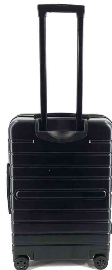
Trolley de voyage, vue de dos