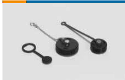
Kappen und Abdeckungen für Rundsteckverbinder(16)