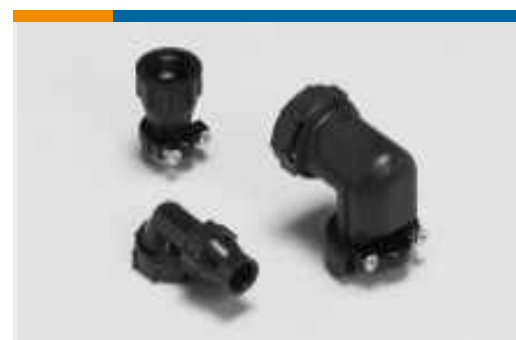
Ungeschirmte Abdeckkappen und Kabelklemmen für Rundsteckverbinder (56)