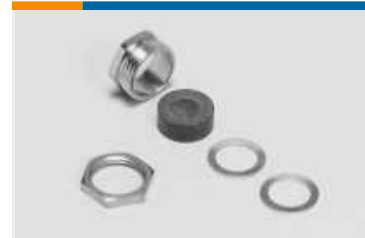
Komponenten für Rundsteckverbinder (3)