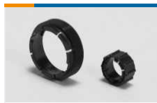
Adapter für Rundsteckverbinder(7)