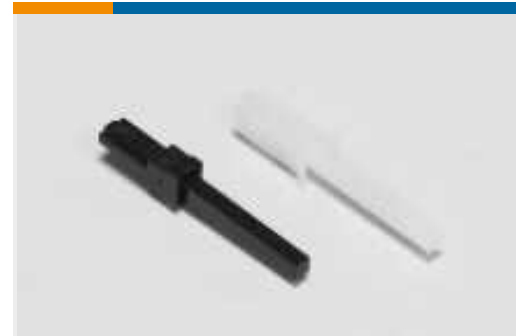
Kodierstifte für Rundsteckverbinder(2)