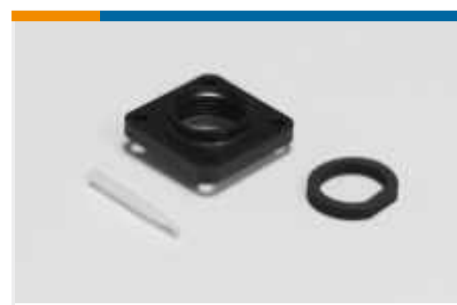
Dichtungen für Rundsteckverbinder(36)