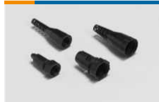
Kappen und Zugentlastung für Rundsteckverbinder(6)