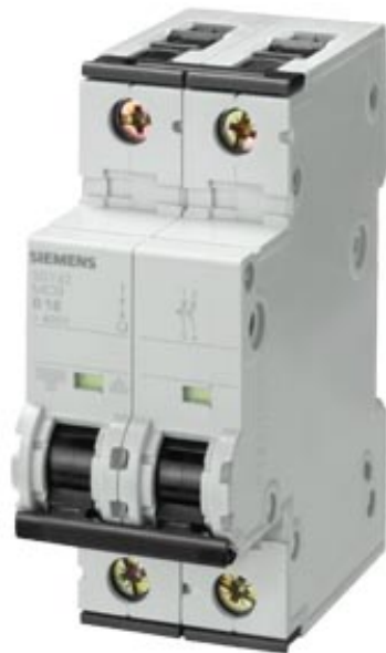
LEITUNGSSCHUTZSCHALTER 400V 10KA, 2-POLIG, B, 13A, T=70MM