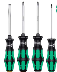
Wera Kraffform Plus 300