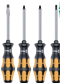
Wera Schraubmeißel Kraffform Plus 900