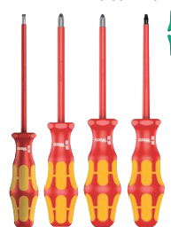
Wera Kraffform Plus 300