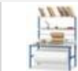
table d'emballage complète, hauteur x largeur x profondeur 850 x 2000 x 800 mm, panneau en acier avec revêtement en plastique résistant à l'usure finition gris clair, piètement 4 pieds en acier avec finition époxy résistante aux chocs et aux rayures en RAL5017 bleu signalisation, 1 dispositif dérouleur/de coupe, 2 tablettes, 8 manches insérables