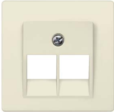
DELTA i-system elektroweiß Abdeckung UAE-Kat.3, 2-fach 55x55mm