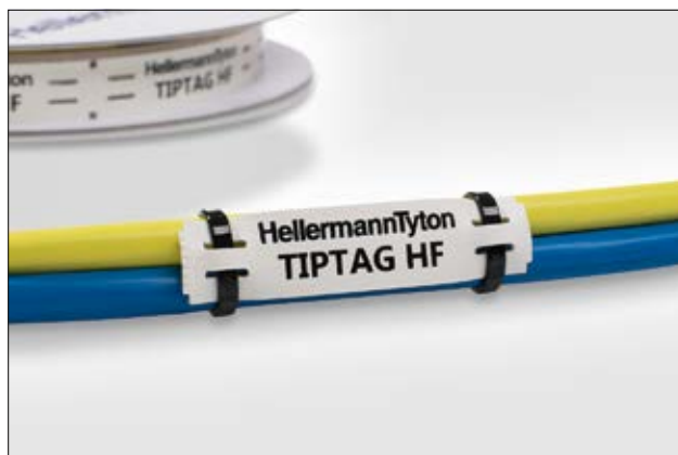
TIPTAG - markering voor kabelbundels met hoge prestaties.