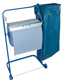
Typ PUTZR ABROLL