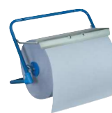
Typ PUTZR ABROLLW

Alle Angaben verstehen sich als unverbindliche Richtwerte! Für nicht schriftlich bestätigte Datenauswahl übernehmen wir keine Haftung. Druckangaben beziehen sich, soweit nicht anders angegeben, auf Flüssigkeiten der Gruppe II bei +20°C.