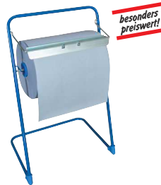
Typ PUTZR ABROLL B