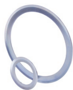
Bordscheiben Seite 198