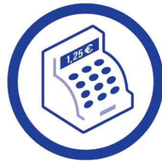
Ihre Vorteile auf einen Blick