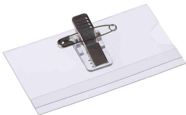
Porte-nom, avec pince combinée