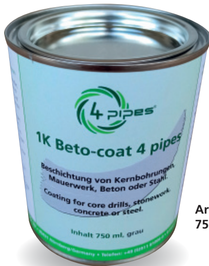
Art.-Nr. 13096 750 ml Dose