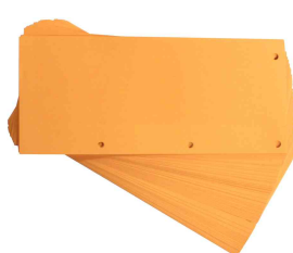
Intercalaires Duo, orange