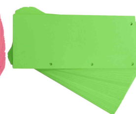
Intercalaires Duo, vert