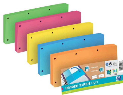
visuel de référence: Intercalaires Duo, collection d'image