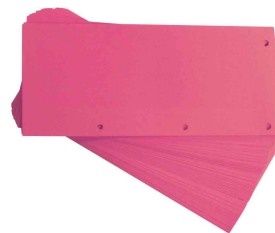
Intercalaires Duo, rose