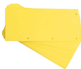
Intercalaires Duo, jaune