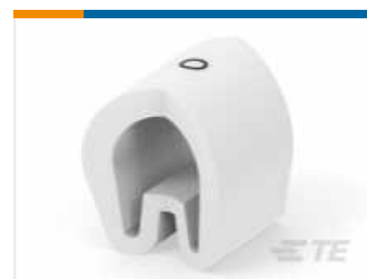
TE Teilnr.: EC9789-000 11593900