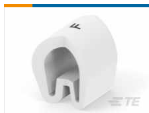
TE Teilnr.: EC6287-000 11591910