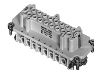
Abbildung stellvertretend für alle verfügbaren Polzahlen.

Unterserie Schwere Steckverbinder C 146 E