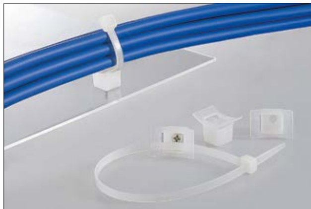
LKC Befestigungssockel bieten idealen Halt durch gewölbtes Design.