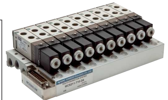
Anwendungsbeispiel für ein komplett aufgebautes Ventilterminal

Ventilbreite: 18 mm Weitere Maße finden Sie in den Artikeldetails in unserem