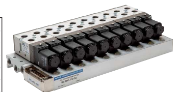
Anwendungsbeispiel für ein komplett aufgebautes Ventilterminal

Ventilbreite: 26,8 mm Weitere Maße finden Sie in den Artikeldetails in unserem Online-Shop!