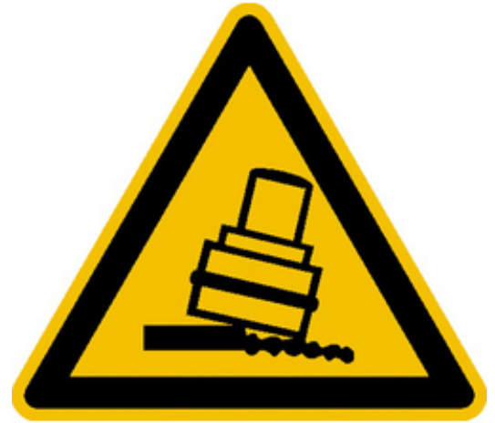
Modellbeispiel: Warnschild Warnung vor Kippgefahr beim Walzen (Art. 21.0322)