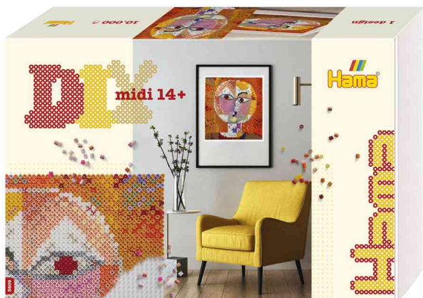
Perles à repasser midi Art "Paul Klee", coffret cadeau

ATTENTION : ne convient pas aux enfants de moins de 36 mois en raison des petites pièces qui peuvent être avalées.