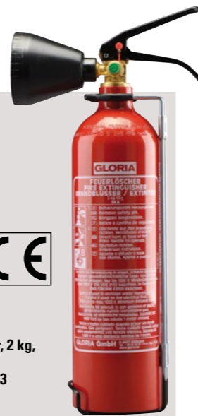
Kohlendioxidlöscher, 2 kg, mit Drahhalter, Bestell-Nr. 116-170-33