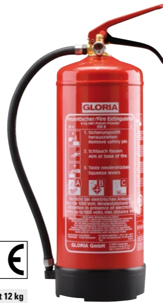
Dauerdruckpulverlöscher, 6 kg, Bestell-Nr. 123-589-33