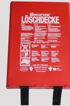
Löschdecke NoFire, Box

Lieferung in einer Kunststoff-Wandbox, mit Aufhängeöse. Außenmaß B x T x H (mm): 175 x 45 x 250