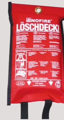
Löschdecke NoFire, Polybag

Lieferung in einer speziellen Kunststofftasche, mit Aufhängeöse. Außenmaß B x T x H (mm): 190 x 45 x 310