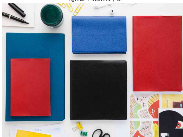
Visuel de référence: gamme IMPALA