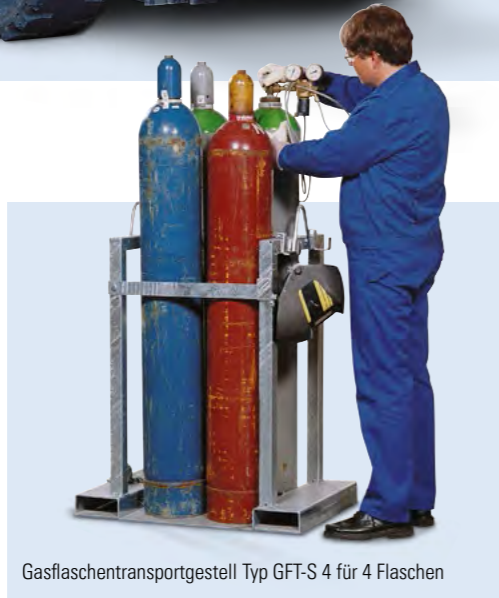
Gasflaschentransportgestell Typ GFT-S 4 für 4 Flaschen