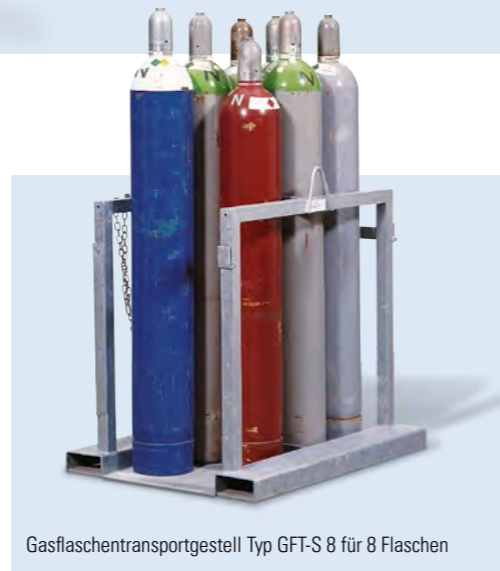
Gasflaschentransportgestell Typ GFT-S 8 für 8 Flaschen