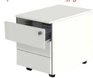
Accessoire: Caisson mobile N:\VivalP\Koepe\79837\4647.jpg