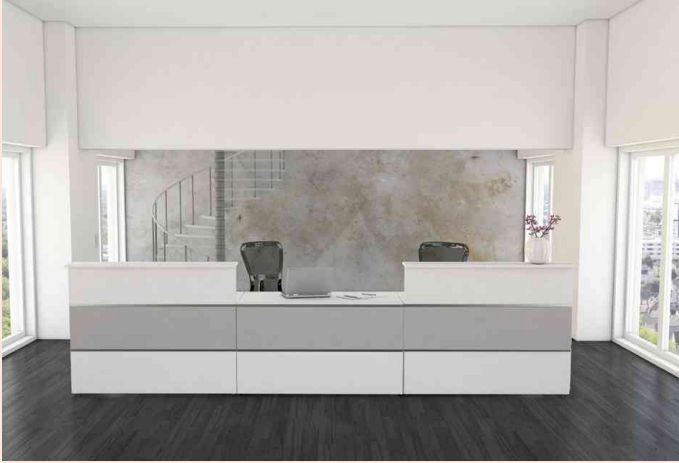
Illustration: Comptoir d'accueil Atlantis 3