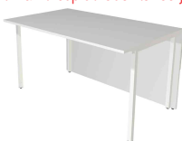
2) Table annexe, 2 côtés droits N:\VivalP\Koepe\79837\3271.jpg