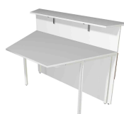
1) Comptoir de base, 2 côtés obliques N:\VivalP\Koepe\79837\3270.jpg