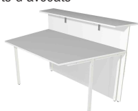
1) Comptoir de base, 1 côté oblique N:\VivalP\Koepe\79837\3269.jpg