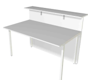
1) Comptoir de base, 2 côtés droits N:\VivalP\Koepe\79837\3268.jpg