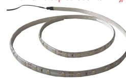
Accessoire: Barre d'éclairage à LED N:\VivalP\Koepe\79837\3400.jpg