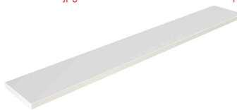
Accessoire: Support pour sacs N:\VivalP\Koepe\79837\3968.jpg