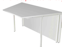
2) Table annexe, 2 côtés obliques N:\VivalP\Koepe\79837\3273.jpg