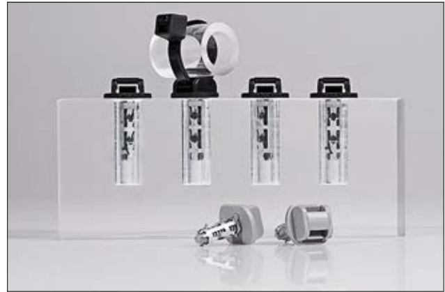
DHA5.5x15 und DHA8.4x20 für Sacklochanwendungen.