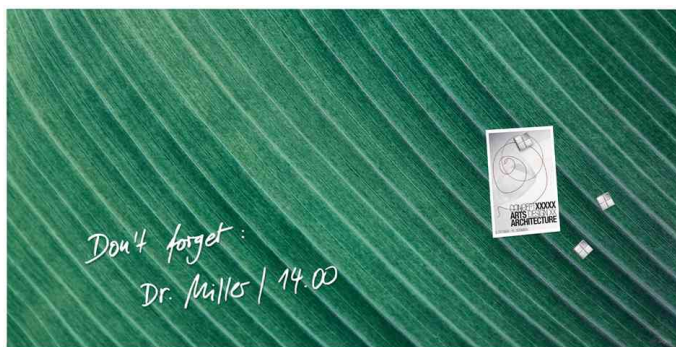
Tableau magnétique en verre