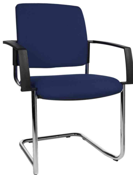
Chaise de bureau "rembourrage BtoB 20", bleu