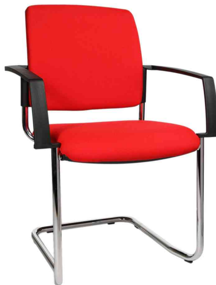
Chaise de bureau "rembourrage BtoB 20", rouge