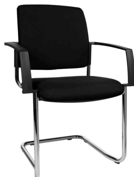
Chaise de bureau "rembourrage BtoB 20", noir