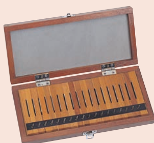
18 db-os acél hasábkészlet

Pontosság EN ISO 3650 (incl. 0,1-0,49 mm)