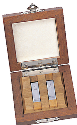
2 db-os hasábkészlet