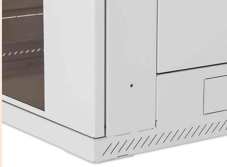
Detailansicht: breitere Schrankecken