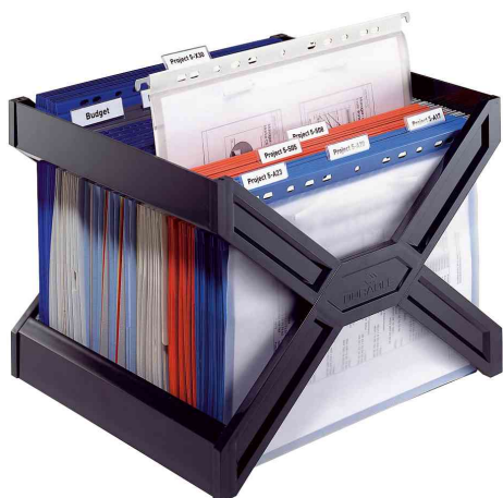
Bac pour dossiers suspendus CARRY® plus, utilisation