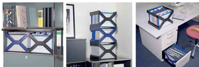
Bac pour dossiers suspendus CARRY® plus, exemples d'utilisation