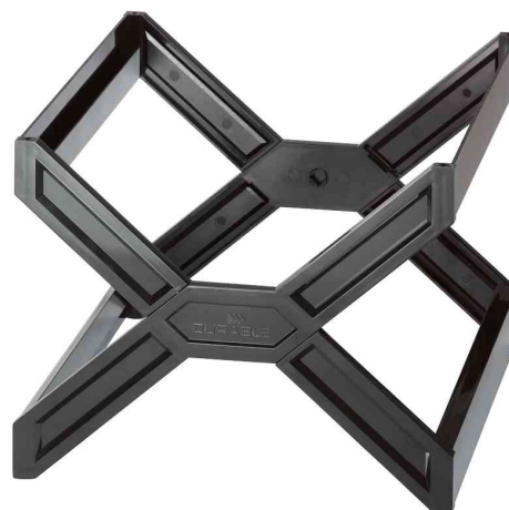
Bac pour dossiers suspendus CARRY® plus, noir