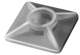
120 C - 122 C