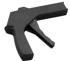
WIT 3A / WIT 3C