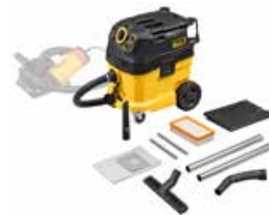
Saugen von gesundheitsgefährdenden Stäuben beim Trennen und Schlitzzen: REMS Pull 2 M Set