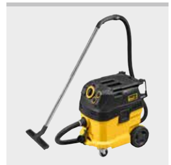
Zertifizierte Sauger und Entstauber zur Aufnahme gesundheitsgefährdender Stäube nach EN 60335-2-69.