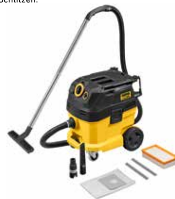
REMS Pull 2 L Set

Saugen von gesundheitsgefährdenden Stäuben beim Trennen und Schlitzzen: REMS Pull 2 L Set