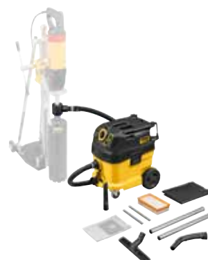
Saugen von gesundheitsgefährdenden Stäuben beim Trockenbohren: REMS Pull 2 M Set D