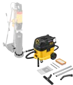
Saugen von Bohrschlamm beim Nassbohren mit REMS Bohrständern: REMS Pull 2 L Set W

Zum Saugen von Wasser Flachfilter PES erforderlich. Bei Bedarf Nassfilterbeutel oder Polyethylenbeutel verwenden. Nassfilterbeutel trennen beim Saugen von Schmutzwasser das Wasser von den eingesaugten Feststoffen. Polyethylenbeutel vereinfachen die Schmutzentsorgung und verhindern Schmutzablagerungen im Behälter.