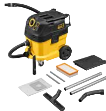
REMS Pull 2 M Set