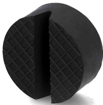
Coussin en caoutchouc pour cric de levage