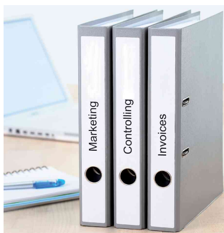
Orderrücken-Etiketten SPECIAL, Anwendung