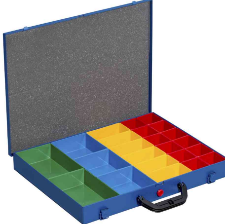
EuroPlus Pro M 44L-23