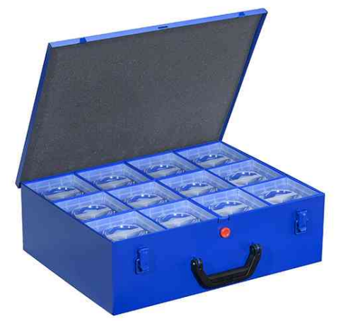
EuroPlus Pro M 44XH-12L