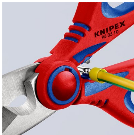
Szybkie i wygodne zagniatanie