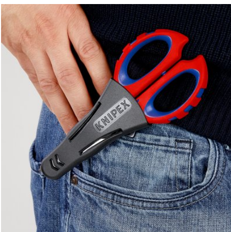
!Sicher verstaut und immer griffbereit!

Dopuszcza się zmiany i błędy w podanych parametrach technicznych