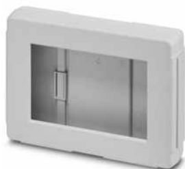
Display-Gehäuse 7" lichtgrau, Fenster mittig, Front eben, bestehend aus zwei Halbschalen, vier stirnseitige Blenden mit Schrauben

Bitte beachten Sie, dass die hier angegebenen Daten dem Online-Katalog entnommen sind. Die vollständigen Informationen und Daten entnehmen Sie bitte der Anwenderdokumentation. Es gelten die Allgemeinen Nutzungsbedingungen für Internet-Downloads. ( http://phoenixcontact.de/download )