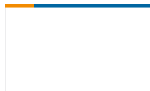
TE Teilnr.:CT66253001 FTR16-6-OCK0439