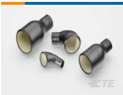
TE Teilnr.:491908-003 202K174-25-02/225-CS-1858