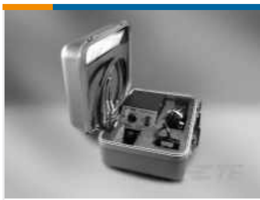
TE Teilnr.: 173643-000 RH-3960-1-TINEL-KIT-120V