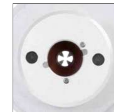
Adapterring an Zangen für Einzelkontaktaufnahmen