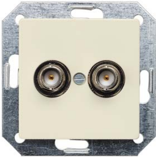
I-SYSTEM, ELEKTROWEISS BNC-STECKBUCHSE 2-FACH, 75OHM ABDECKPLATTE 55X55MM