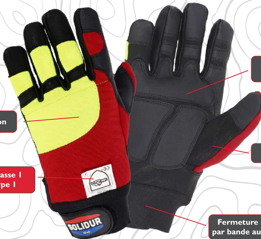
SCHÉMA DÉTAILLÉ - GANTS INFINITY